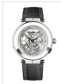
Newport Slim Skeleton

Die im Markt bekannte französische Uhrenmarke Michel Herbelin feierte im letzten Jahr ihr 75. Jubiläum. Zu diesem Anlass präsentiert die Marke auch eine neue Identität, „die mehr denn je auf Eleganz, Raffinesse und uhrmacherisches Savoir-faire aus Frankreich ausgerichtet ist. Dies ist mit einem einzigen Namen verbunden: HERBELIN – Moderne Uhrmacherkunst seit 1947.“ Die Geschichte von HERBELIN ist nach eigenen Angaben von der Kreierung emblematischer Linien geprägt und deren Neuinterpretationen im Rhythmus der jeweiligen Trends. So erschien 1988 erstmals die Newport. Das ikonische Modell mit maritimer Inspiration lädt dazu ein, mit Eleganz, Kraft und Präzision durch die Zeit zu reisen. Ihr weltweiter Erfolg wird zum Aushängeschild der Marke. So auch die elegante Antarès. Mit ihrem Armbandwechselsystem lässt sie sich vielseitig kombinieren.