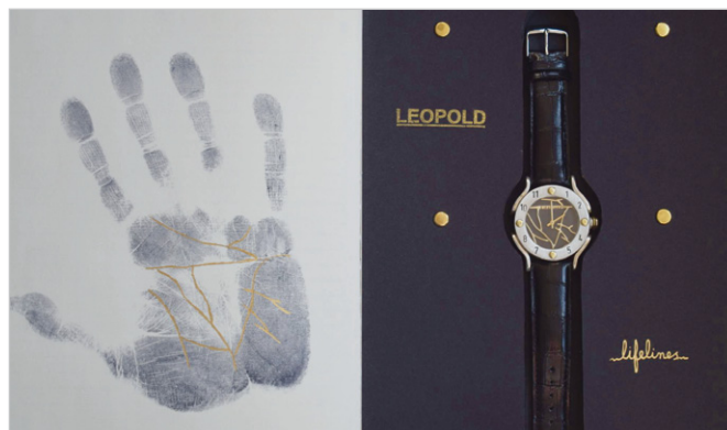
Kollektion 'Lifeline'