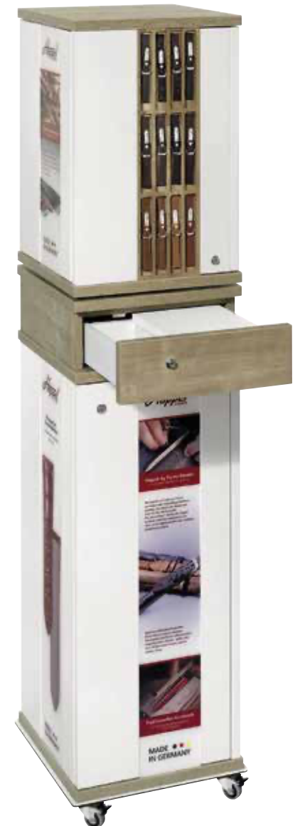
HAPPEL DISPLAY-STÄNDER FÜR LEDERBÄNDER

echt Shell Cordovan, Naht: Ton in Ton, Bandstärke: ca. 2,5 mm