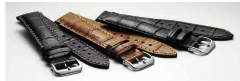
UHRBÄNDER HAPPEL BY FLUME

Auch die Made-in-Germany-Marke Happel von Flume hat ein vollumfängliches P.O.S.-Konzept für Juweliere und Goldschmiede. Zur Inhorgenta 2023 erscheint ein aktueller Katalog mit allen Neuheiten rund um die Kategorien Bio, Vegan, Vintage, Nato, Premium, Wasserfest, Markenersatzbänder ...!