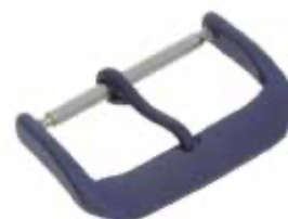
DORNSCHLIESSE + FEDERSTEG